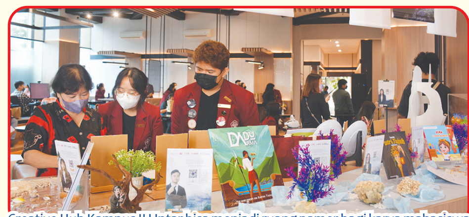
Creative Hub Kampus II Untar bisa menjadi ruang pameran karya mahasiswa dan dosen.