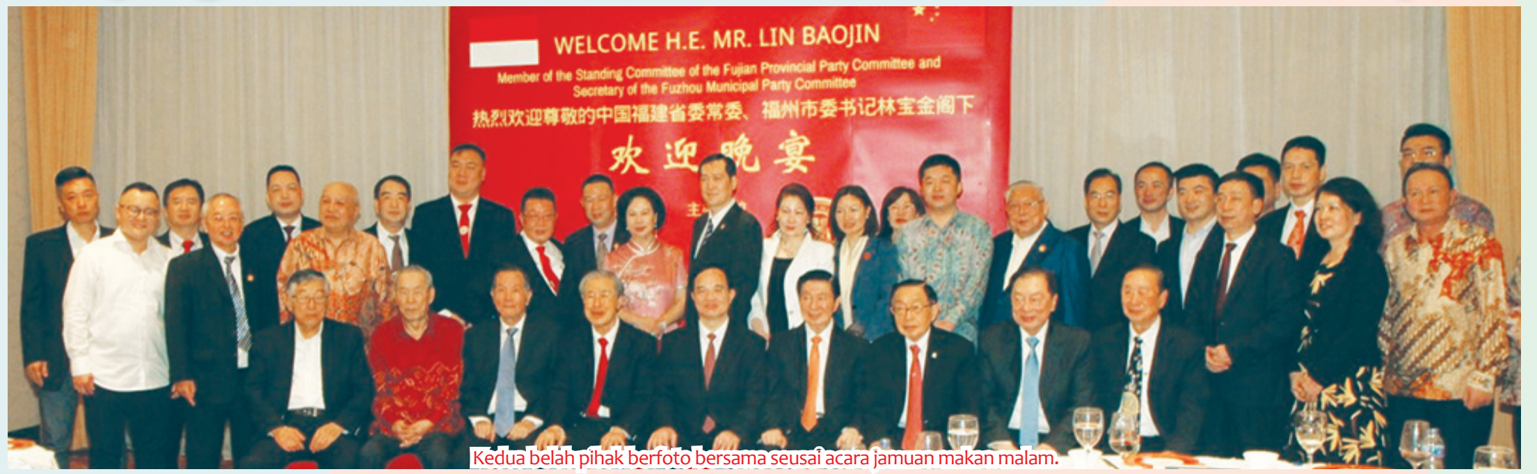
Kedua belah pihak berfoto bersama sesuai acara jamuan makan malam.