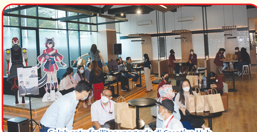
Salah satu fasilitas yang ada di Creative Hub.