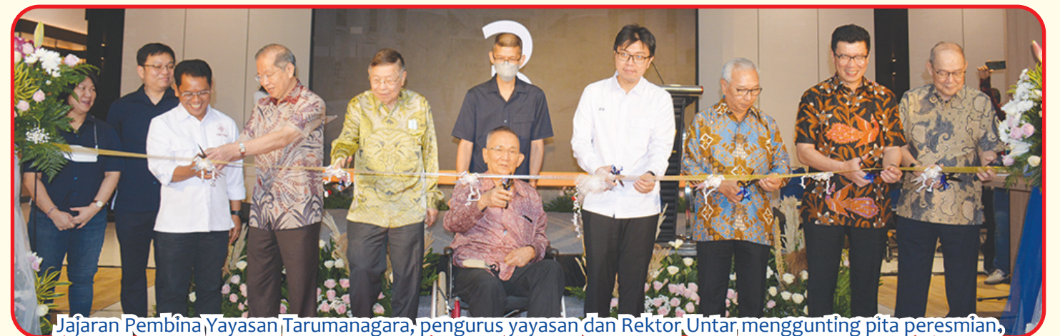
Jajaran Pembina Yayasan Tarumanagara, pengurus yayasan dan Rektor, Untar, menggunting pita peresmian.

"Creative Hub Kampus II Untar merupakan fasilitas penunjang akademik yang akan digunakan oleh sivitas akademika Untar terutama mahasiswa dalam mengembangkan kreativitas dan inovasi, khususnya dalam hal entrepreneurship," ujar Ketua Pengurus Yayasan Tarumanagara